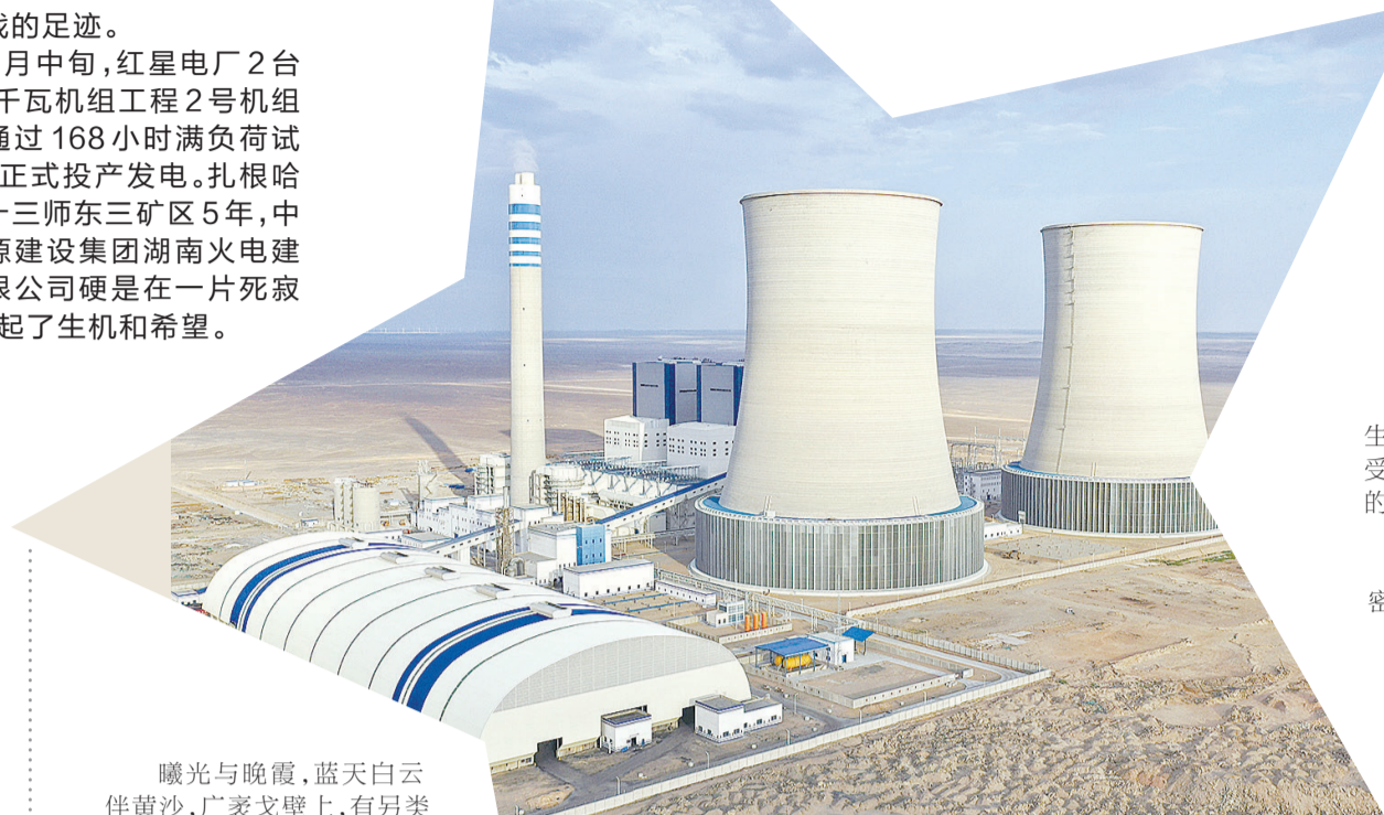
红星电厂项目全貌

“这是湖南火电到目前为止,接到的最难的项目。”詹中秋说,作为国内最大的PC项目,关注的人多,项目管理要求特别严,这一刻,紧绷了1736个日夜的弦,终于可以松下。