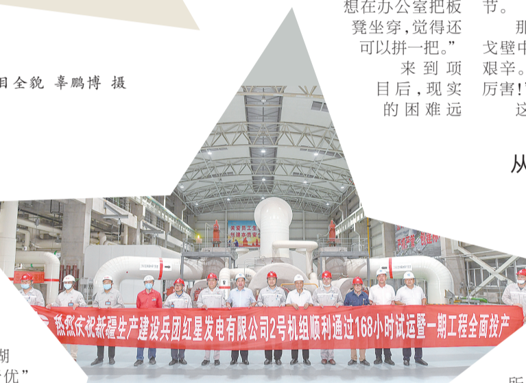
2号机组竣工投产

“截至目前,1号机组是新疆地区运行最好的发电机组,2号机组建设中,各个节点工程均为一次性完工,自动化投入率达到100%。”中煤红星发电有限公司总经理李虎的点评,为红星电厂项目建设画上完美句点。