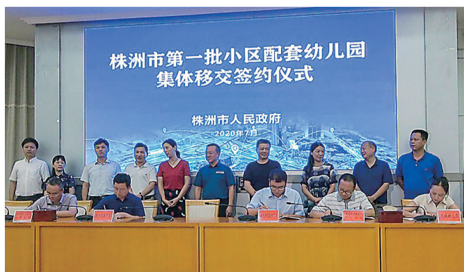
第一批小区配套幼儿园集体移交签约仪式现场。

7月30日下午,株洲市第一批小区配套幼儿园集体移交签约仪式,在市政府举行。城区各教育局负责人,与25家小区房地产商和配套幼儿园经营者进行了移交签约。