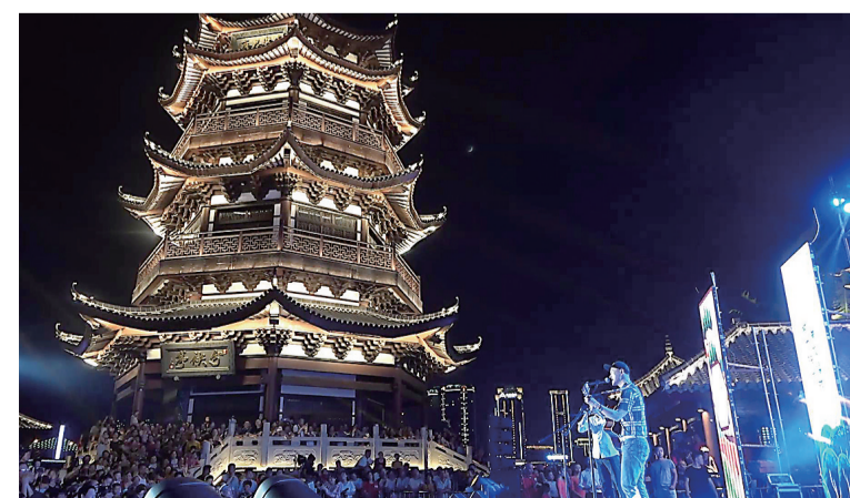
社区大舞台活动在分秧亭拉开帷幕。

7月24日晚,《牵手文旅融合·奏响诗与远方》2020年株洲市社区大舞台活动,在湘江风光带分秧亭拉开帷幕。