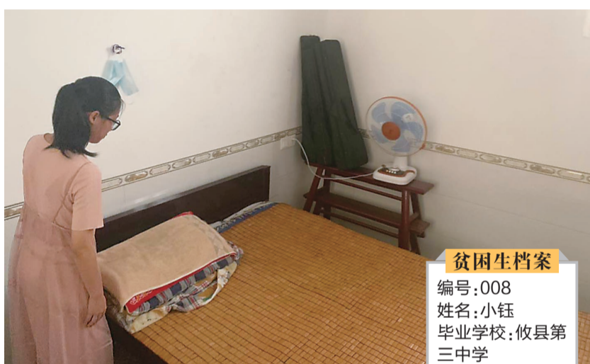
▲小钰房间里的陈设十分简单