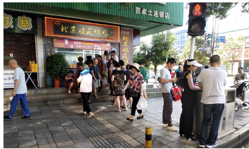
▲被投诉的烤鸭店

近日,家住贺家路的黄女士拨打晚报热线28829110投诉:我晚上散步时,不知地上有油,一踩上去就滑倒了。当时我怀里抱着不到两岁的女儿,我们母女俩都摔得不轻。希望记者能实地调查,是谁这么没公德心?