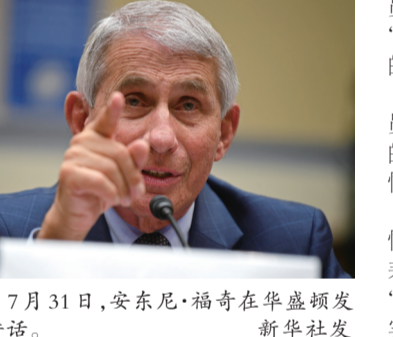
7月31日,安东尼·福奇在华盛顿发表讲话。

据新华社华盛顿7月31日电 美国约翰斯·霍普金斯大学7月31日发布的新冠疫情最新统计数据,美国累计确诊病例超过450万例。 数据显示,截至美国东部时间7月31日14时58分(北京时间8月1日2时58分),美国累计确诊病例4536240例,累计死亡病例152878例。数据显示,美国累计确诊病例最多的州是加利福尼亚州,为493396例。佛罗里达州、得克萨斯州、纽约州确诊病例均超过40万例。 美国国家过敏症和传染病研究所所长、白宫冠状病毒应对工作组重要成员安东尼·福奇7月31日表示,未全面“关闭”是导致近期美国新冠病例激增的主要因素之一。 当天,美国众议院新冠疫情防控小组委员会举行题为“急需国家计划控制疫情”的听证会,聚焦如何从国家层面解决疫情应对、疫苗研发、学校重启等问题。 在被问及为何欧洲能够有效控制疫情而美国的病例却在持续增加时,福奇表示,欧洲超过95%的地区都切实实行“禁令”“居家令”等措施。但反观美国,事实上全美只有50%的地区真正“关闭”。他说,美国一些州未能严格遵循白宫关于“分阶段”重启“美国经济的指导方针”。 在谈及新冠疫苗研发进展时,福奇表示,根据动物实验数据及早期人体试验数据来看,他对今年底或明年初研发出安全、有效的新冠疫苗表示“谨慎乐观”。福奇表示,新冠疫苗面世后,并非所有美国人都能马上接种,可能会分阶段实施接种计划。 在谈及美国学校复学问题时,美国疾病控制和预防中心主任罗伯特·雷德菲尔德表示,关闭学校会产生很多公共健康方面的严重后果,包括学生不能从学校获得心理健康帮助等。