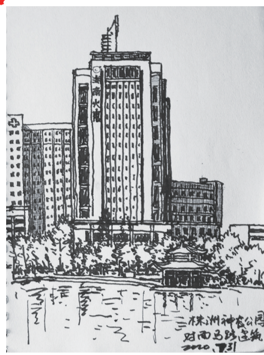
速写:城市掠影(作者:骆景辉)