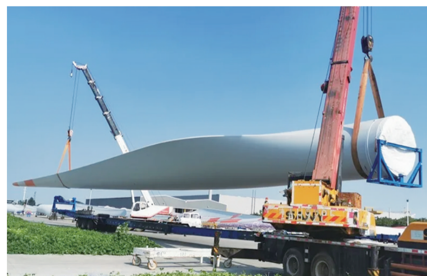
▲叶片出厂发货

本报讯(记者 伍靖雯)近日,由株洲时代新材料科技股份有限公司与风电行业国际巨头——维斯塔斯共同开发的首批V155叶片出厂发货,标志着双方合作迈上新台阶。