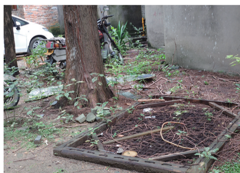
▲芦淞区某小区卫生情况堪忧,存在垃圾乱堆乱放现象

随后,检查人员来到芦淞区某老旧小区。在该小区某栋1楼,大大小小的“牛皮癣”布满楼道墙面,一些电线裸露在外,错综复杂,存在一定安全隐患。楼道墙面斑驳,楼梯间还存在蜘蛛网,楼道地面上有烟头及杂物等。此外,该小区还存在垃圾未及时清