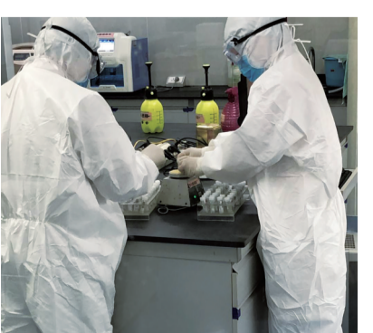
▲样本灭活后震荡混匀。

“我院新冠病毒核酸检测项目对外开放,有核酸检测需求的人员可到市二医院找医生开检查单,到检验科