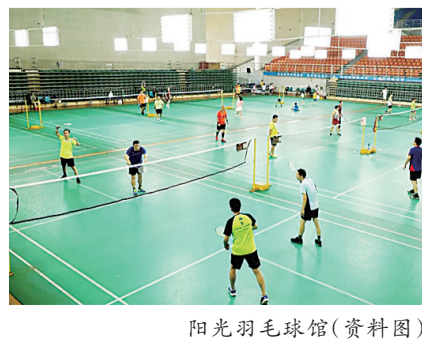
阳光羽毛球馆(资料图)