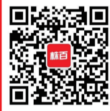
扫码关注 株百官方公众号