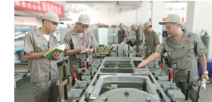
▲昨天上午,我市一轨道交通装备企业里,员工们正在接受培训