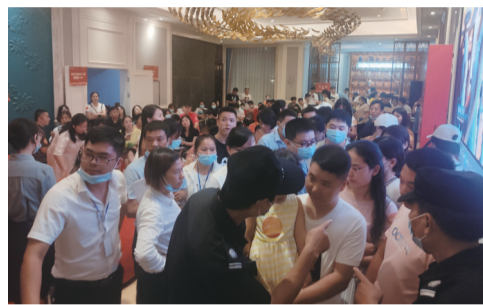
▲排队准备进场选房的客户

在各位来宾的共同见证下,株洲高科集团有限公司、湖南天易集团有限公司、株洲高科房地产开发有限公司相关领导共同启动高科房产·城市展厅剪彩,城市展厅在这一刻正式启幕,为株洲人居生活开启了华丽的新篇章。2020年,高科房产乘着株洲发展大势整