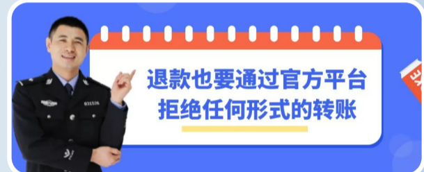
株洲市公安局开设“陶sir说电诈”专栏,宣传反电信诈骗知识。