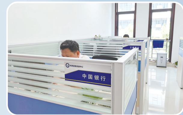
在市反电诈中心,银行工作人员正在对可疑银行卡账号进行梳理。