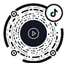
▲打开“抖音”扫码看现场视频 记者 戴凇 制作

正规燃气公司设置的定点配送点购气。去年,我市置换了4万余个钢瓶,市民如发现钢瓶脏污、生锈,务必留意钢瓶提手上的生产日期钢印。