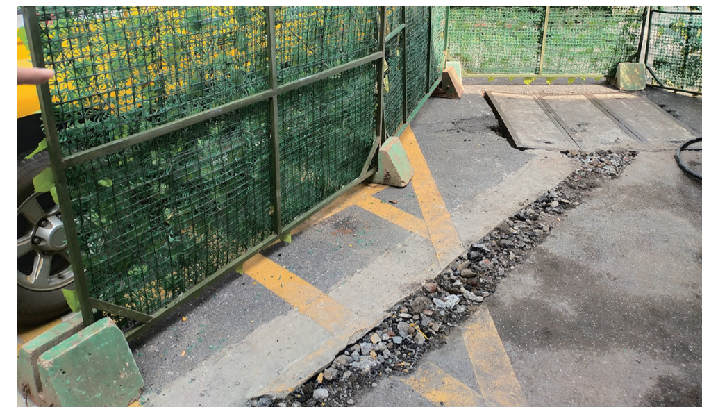
▲被挖开的路面简单填埋着沙石

本报讯(见习记者 廖智勇)25日清晨,天元区市政维护中心工作人员巡查时,在韶山路花园二村附近,发现一处违规施工的5G项目工地。