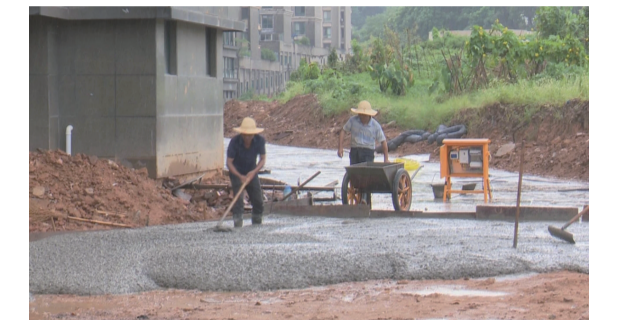
▲施工人员正在修路

前两天,天元区尚格名城小区数名业主拨打市长热线反映,小区附近正在修路,这本是便民利民的好事,可是修路不但遭到大家的阻止,甚至连花管管理处也赶来阻工,希望相关职能部门能介入。