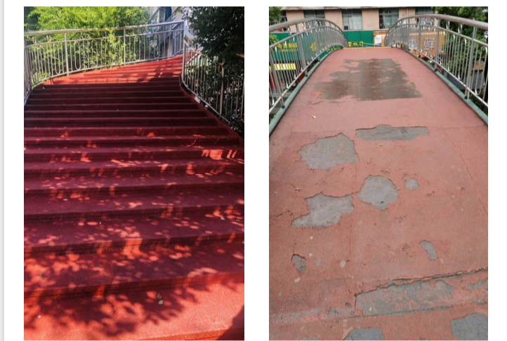
▲铺装完毕后的杉木塘人行天桥