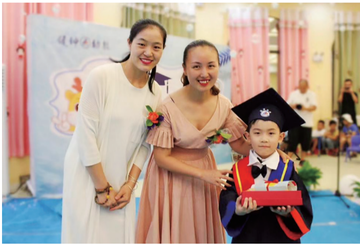
▲“持证”毕业的小朋友

“如果没有生日,长大就不会被标记。没有毕业礼,新的旅程就不算正式开启。仪式提醒着我们从哪里来,我们要去哪里……” 在这个特殊的毕业季,健坤教育将给孩子怎么样的毕业礼呢?