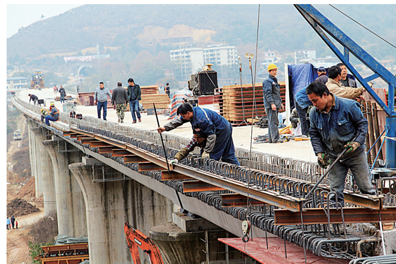
鸭婆塘特大桥,摄于2016年1月1日。