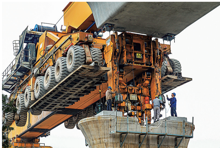
鸭婆塘特大桥,摄于2016年1月4日。