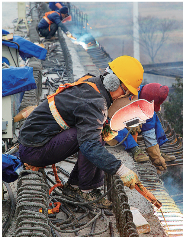
鸭婆塘特大桥,摄于2016年1月16日。