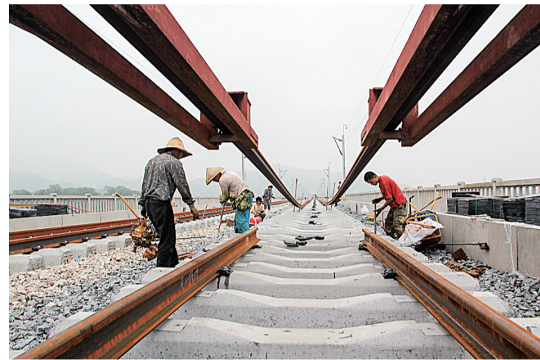
白马垅特大桥,摄于2016年5月27日。