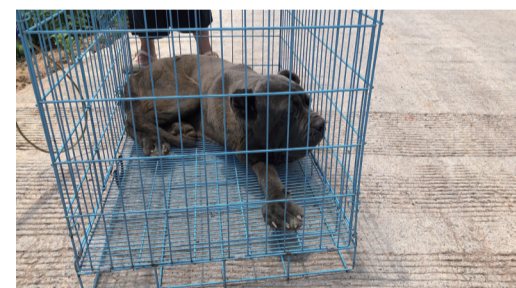
▲狗狗被捕获后关在笼子里

本报讯(记者 李卉 实习生 唐甜)7月23日,一位家住天元区栗雨街道的市民向警方求助,说私房后面的废弃杂物间里出现一只大型犬,本以为是狗只是暂时落脚,没想到一住就是一周。