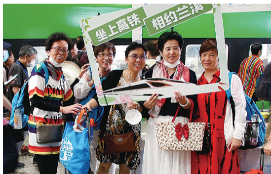
▲7月25日,旅客在上海火车站拍照留念