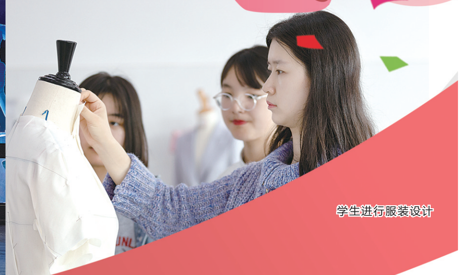
学生进行服装设计