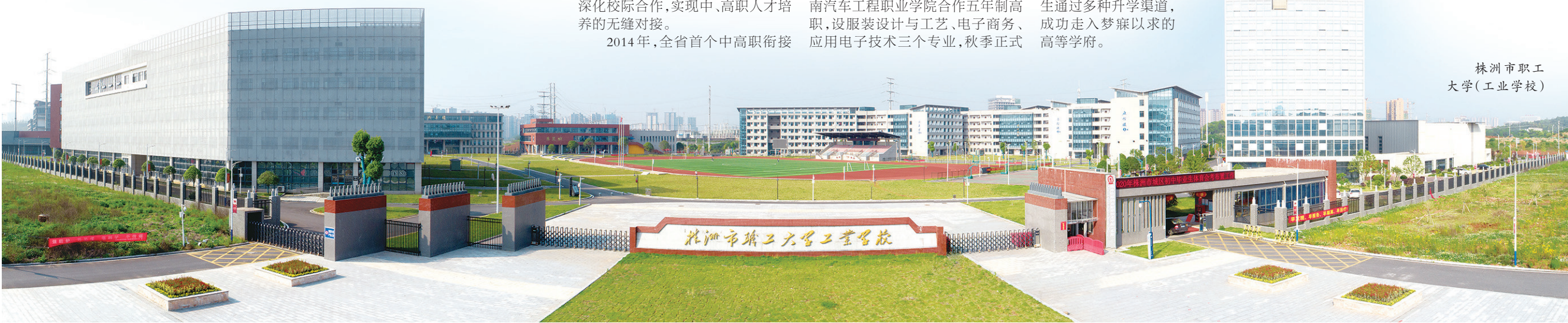
株洲市职工大学(工业学校)

悠悠湘水育人才,近万名实用型服装设计、生产、销售人才从该校走出,服装设计与工艺专业的学生就业率长期稳定在95%以上,甚至出现多家企业争抢毕业生的盛况。从毕业生“就业难”到用工企业“抢才难”,市职大工校不仅实现了“乙方”“甲方”的身份逆袭,更用市场法则检验了“湖湘工匠”的“含金量”。