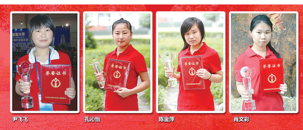
该校在全国职业院校学生技能大赛中取得服装制作项目“四连冠”