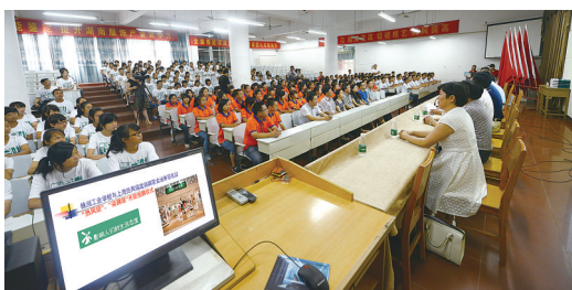
该校与上海热风、福建柒牌两家企业开展的校企合作冠名班