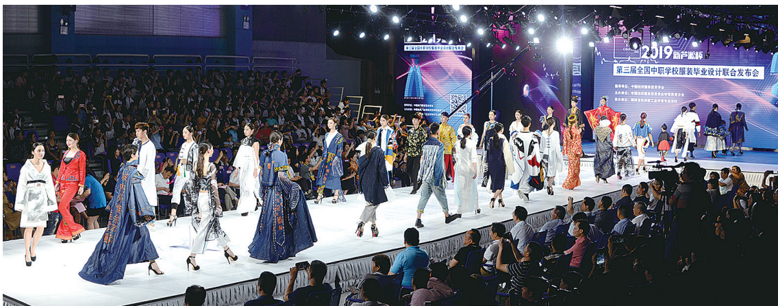
第三届全国中职学校服装毕业设计联合发布会上,该校学子大放异彩