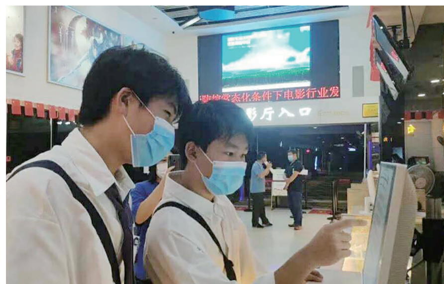
▲昨日,美达国际影城,市民现场购票

20日中午,我市电影院复工后的首场电影《第一次的离别》在横店电影城(大汉店)正式放映。据横店电影城(大汉店)的负责人王先生介绍,首场电影所在影厅开放了45个位子,共有28位市民观看。