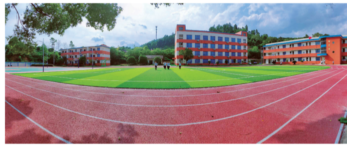
▲校园掠影