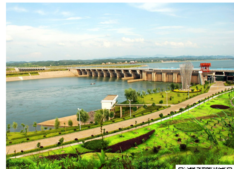
株洲航电枢纽一景(资料图)。株洲航电枢纽、宋亭古镇、凤凰山风景区……跟着我们的航拍镜头走进绿口区,一“绿”向前看绿口美景。