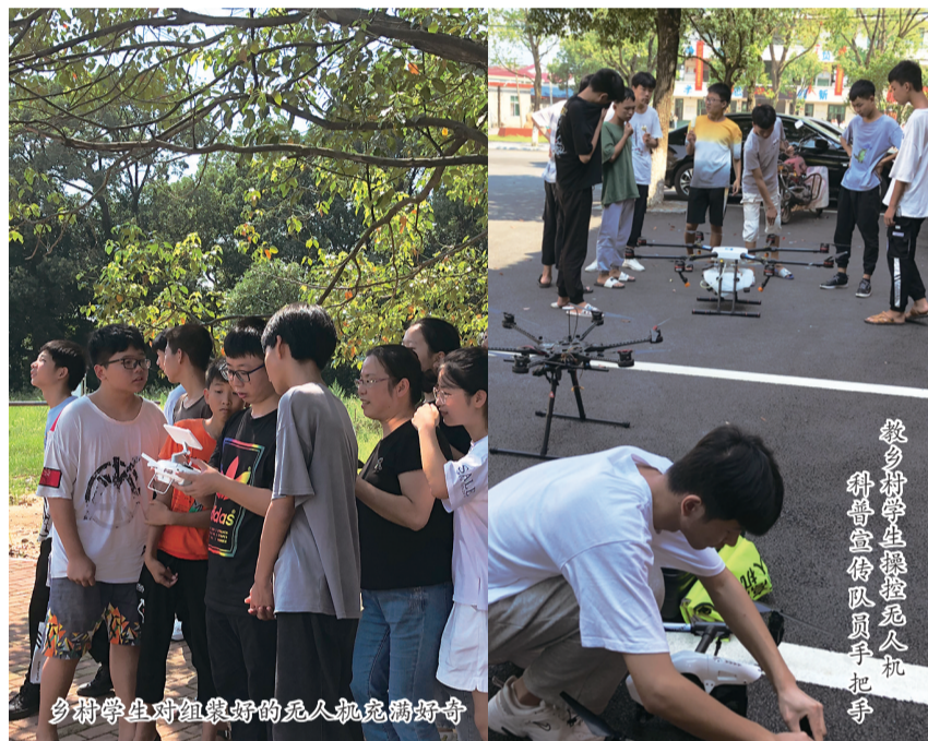
乡间学生对组装好的无人机充满好奇

7月15日,株洲南方航空高级技工学校无人机科普及宣传活动走进茶陵县乡村中学。通过现场组装、试飞演示、高空拍摄等活动,吸引数百名当地青少年前来拓展科技视野,零距离接触、感受无人机操控带来的快乐。