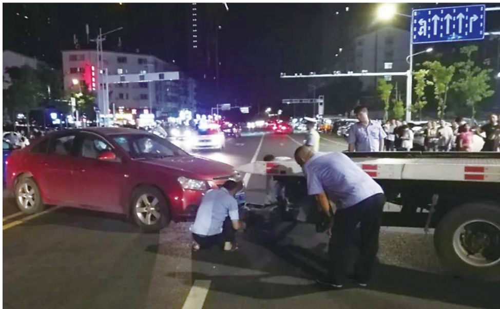
▲一辆私家车违停在路中央,被交警强制拖离