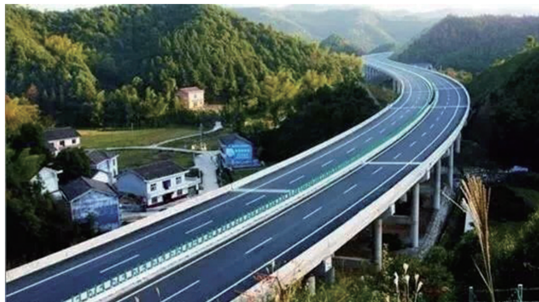
▲平汝高速隆兴坳互通项目效果图

平汝高速隆兴坳互通项目启动以来备受各方瞩目。日前,记者来到这里看到,项目已经进入全面施工阶段。