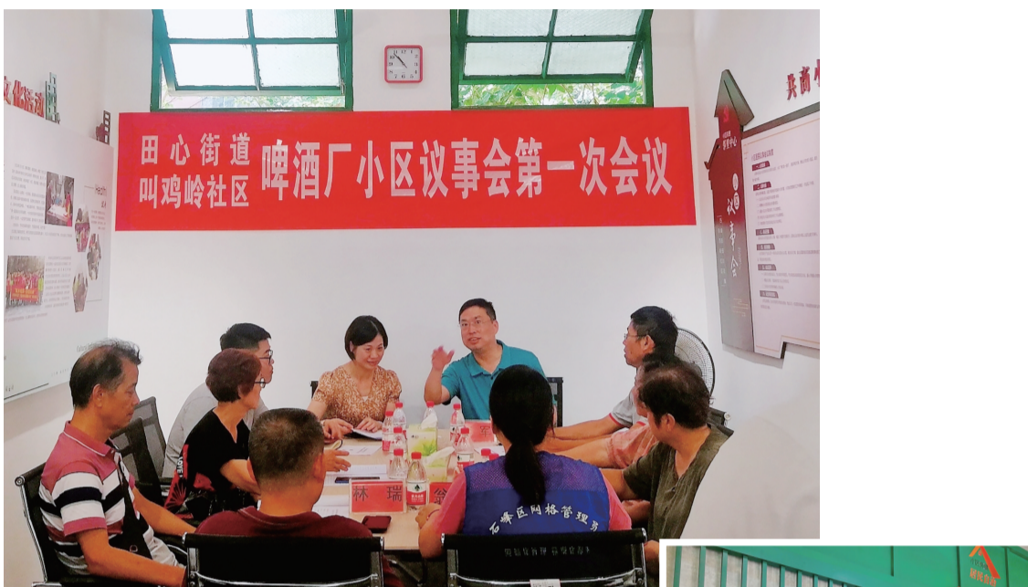
▲昨日上午,啤酒厂小区议事会召开第一次会议

“阵地”建设让居民们找到归属感,疫情防控更是激发了大家的凝聚力。“乘势而上,提高大家的参与感,协助小区党支部和业委会提升业主自治能力。”田心街道相关负责人介绍,在这样的背景下,啤酒厂小区开始试点“居民议事会制度”。