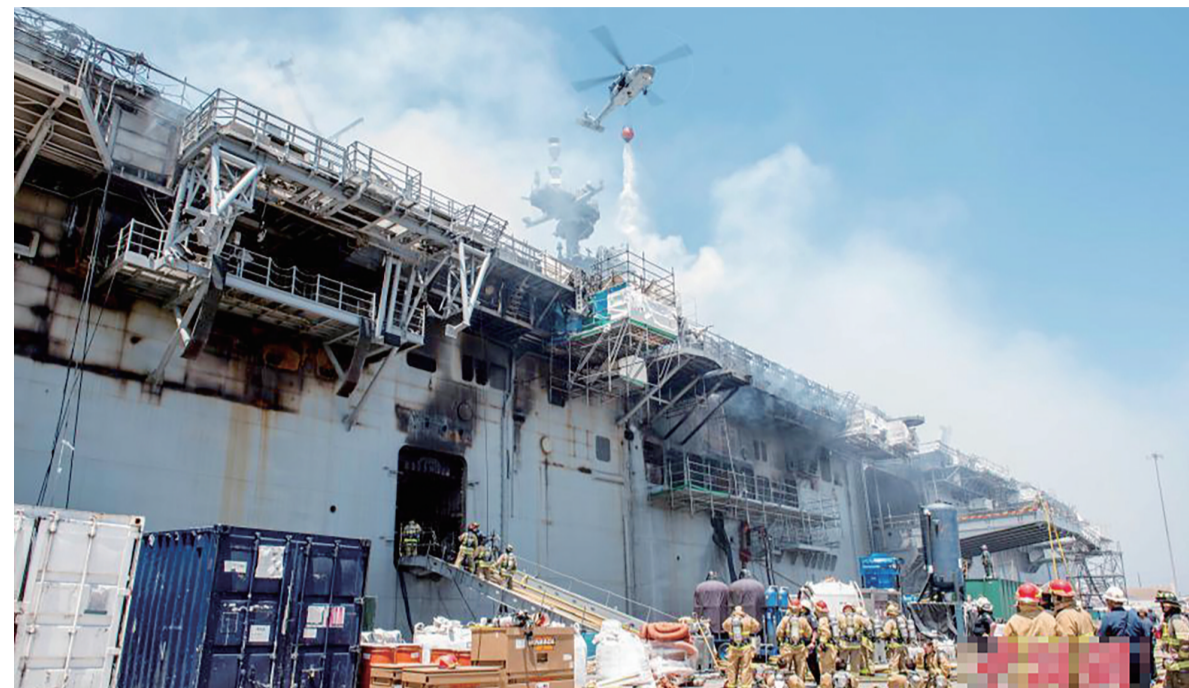
▲7月14日,“好人理查德”号两栖攻击舰在起火48小时后仍在燃烧