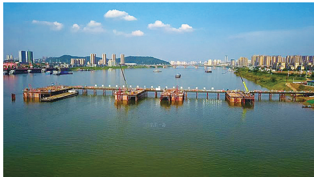
▲昨日,高温天,清水塘大桥(株洲八桥)主桥墩施工现场