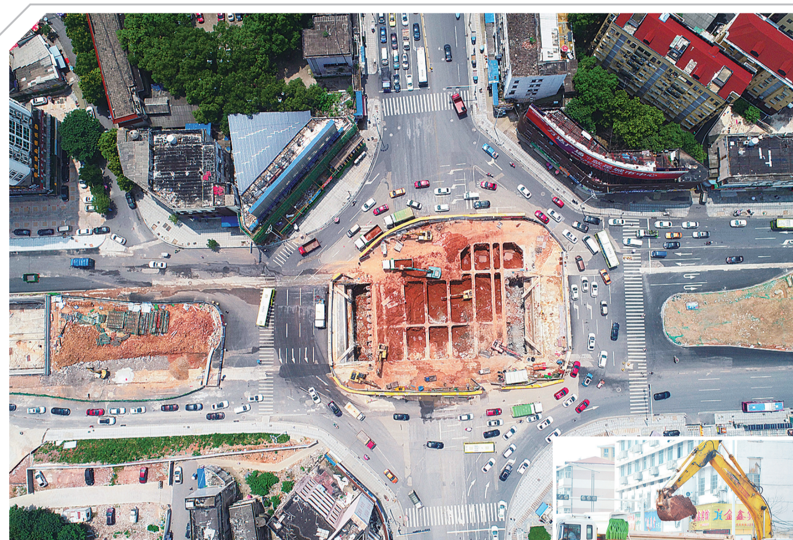
▲▲昨日,响石广场隧道核心段施工现场