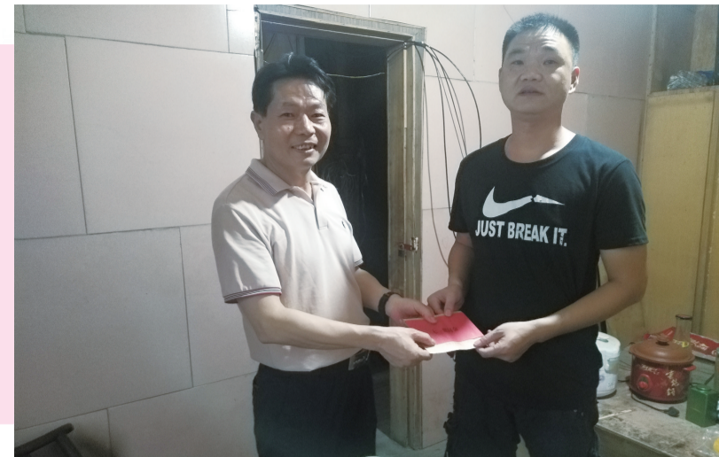
▲市市场监管局党组书记吉振君到社区开展“七一”慰问。