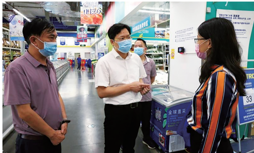
▲市市场监管局局长李余粮在麦德龙超市督导检查食品安全情况。