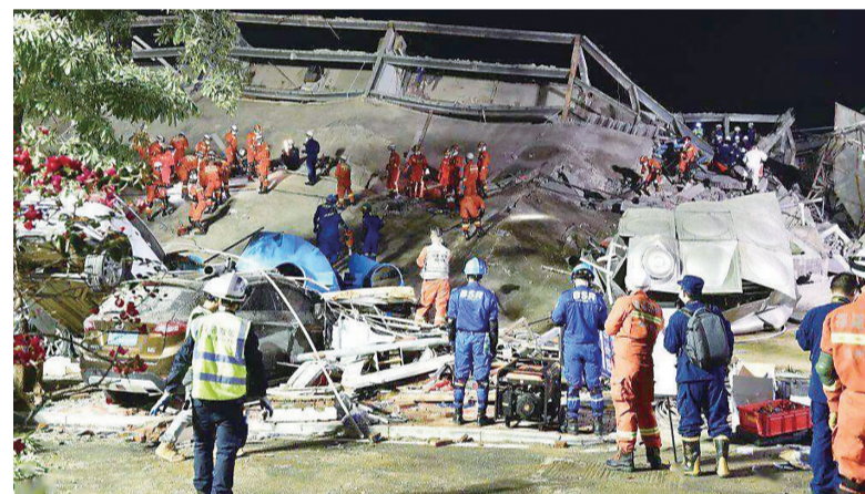
▲欣佳酒店坍塌事故现场(资料图)

记者从福建省有关部门获悉,福建泉州欣佳酒店“3·7”坍塌事故发生后,福建省公安机关对23名相关责任人员依法立案侦查并采取刑事强制措施。福建省纪检监察机关按照干部管理权限,依规依纪依法对事故中涉嫌违纪、职务违法、职务犯罪的49名公职人员严肃追责问责,其中7人移送司法机关追究刑事责任。