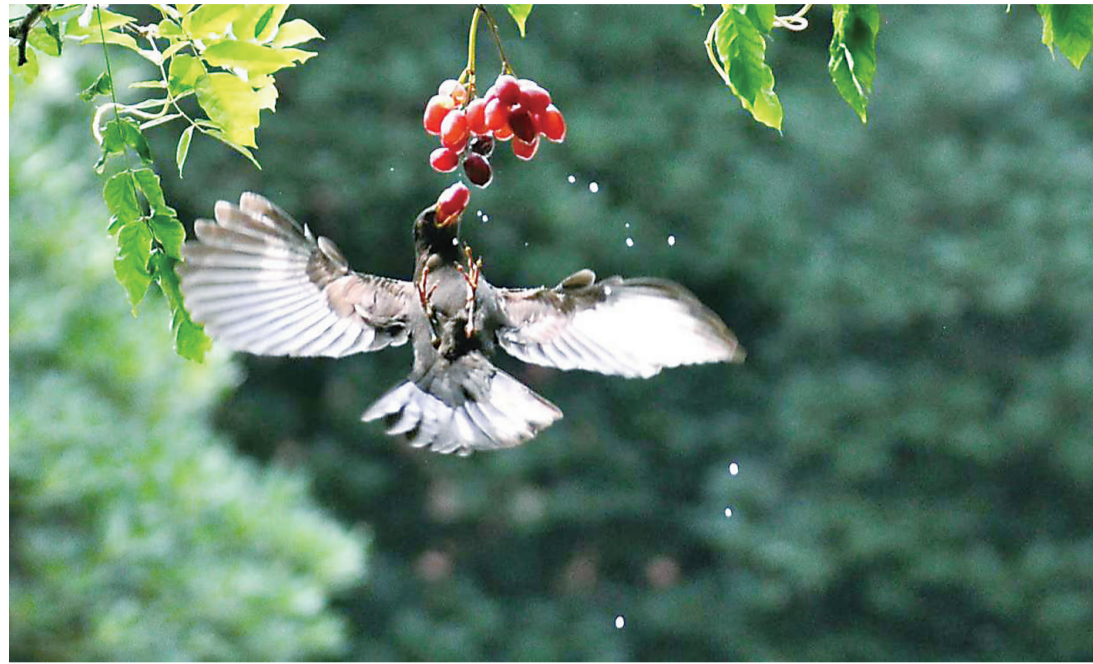
▲近日,天元区悠移庄园,一只红嘴蓝鹊偷吃葡萄

每日金句 陌上繁华,两岸春风轻柳絮。闺中寂寞,一窗夜雨瘦梨花。——陈继儒《小窗幽记》