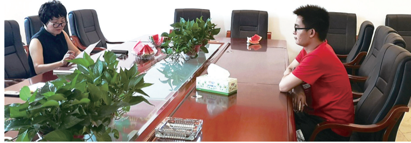
芦淞区“点对点”专场招聘会现场。

自全省“点亮万家灯火”就业帮扶活动启动以来,该区人社局紧盯高校毕业生、农村转移劳动力、城镇就业困难人员、城镇失业人员、退役军人等重点就业人群,通过“线上线下”招聘渠道,为企业与求职者牵线搭桥,把精准就业服务送入千家万户。