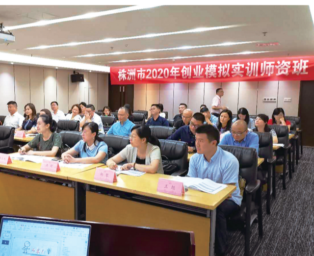
创业模拟实训师资班上,学员们认真听讲。

近年来,我市持续推进“双创”事业,形成了特色鲜明的创业服务体系,尤其是在创业培训师培养、创业培训质量控制、后续服务模式创新等方面,积累了株洲经验,打造出株洲品牌。