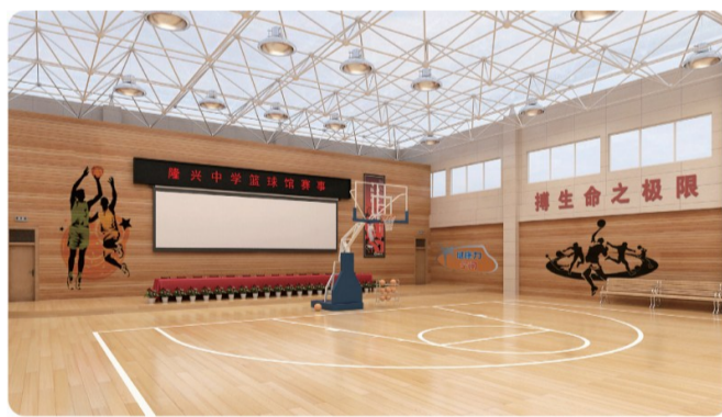
室内体育馆让学生释放活力。 校园内,“隆德至善,兴学求真”的校训格外醒目。