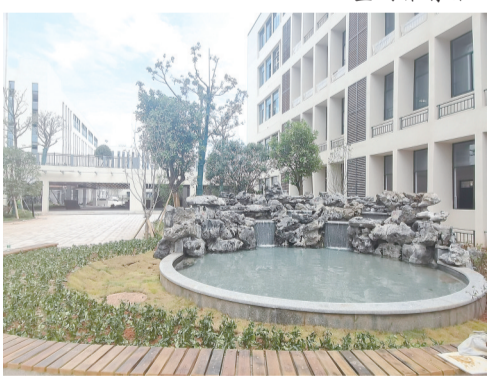
学校按“五园八景”构建花园式校园。