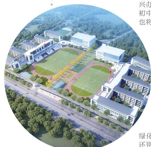
隆兴小学(右侧)与隆兴中学(左侧)今年9月正式迎接新生。