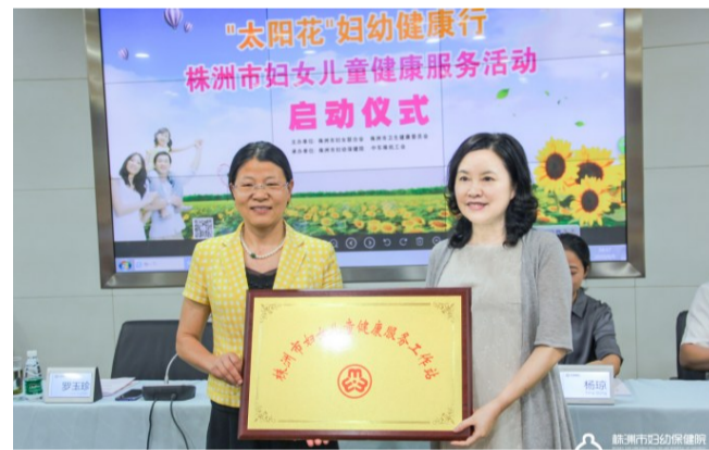
▲与市妇联联合开展妇女儿童健康服务活动

6月28日至7月10日,受市卫健委指派,株洲市妇幼保健院保健部的妇幼保健工作方针,执行“一法两纲”,着力规范母婴保健服务,不断加强内涵建设,增强妇幼保健机构的综合服务能力,努力提高全市妇女儿童健康水平。近三年中,株洲市妇幼保健院累计对各市区完成技术指导与质量评估78次,为全市培训各类妇幼健康服务人员3856人次,举办学术会议或讲座177场,派出专家1600余人次,有力保障了全市妇幼保健服务工作的全面完成。