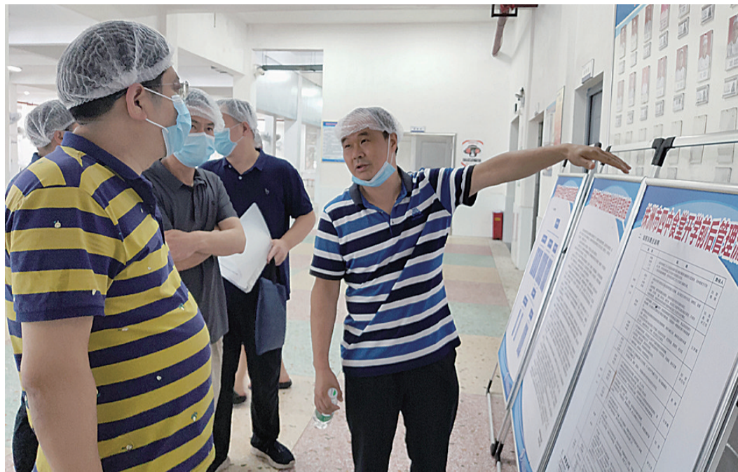
▲ 督查组抽查学校食堂落实食品安全制度情况

组织各县市区局按照“布局合理、方便群众、满足需要”的原则,在全市设定了未加碘食盐供应网点 419 个,并依法在局网站进行公示,接受社会各界监督。5月27日,对全市 24 家大型食盐经营户组织进行了食盐安全知识培训。