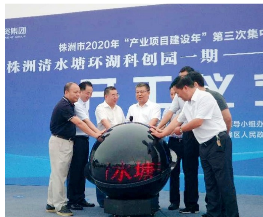
▲昨日,清水塘环湖科创园一期开工仪式现场

产业项目建设年 本报讯(记者 周嵩 李卉 戴凇 王娜 肖捷)昨日,我市2020年“产业项目建设年”第三次集中开竣工活动举行,溁口科创产业园、中南高科产业园、湖南(云龙)大数据产业园大数据应用中心、清水塘产业服务中心、枫溪学校、株洲汇隆三一一道依茨发动机配套工程等90个项目集中开竣工。市人大常委会党组书记、副主任彭建忠等市领导分赴各区出席相关项目开竣工活动。 市领导杨玉芳、何剑波、邓为民、聂方红、覃万成、冯建湘、刘春生、钟燕、李晓葵、杨胜跃、谭可敏、王卫安、余明刚、余群明、周恕、柳怀德、株洲高新区管委会主任朱振湘分别参加相关项目开竣工活动。 本次90个集中开竣工项目中,新开工项目69个,总投资229.41亿元,年度计划投资70.96亿元,在新开工项目中有产业项目45个,总投资152.66亿元,年度计划投资45.36亿元;竣工项目21个,总投资46.89亿元。