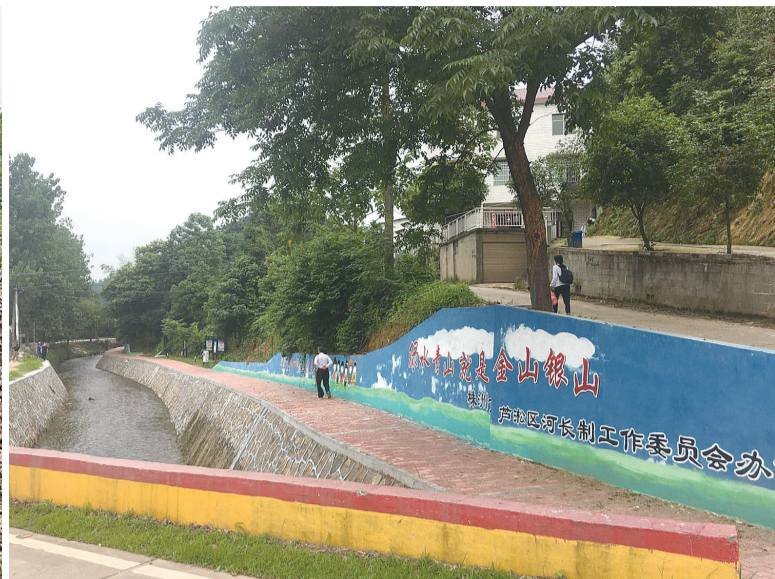
枫溪港芦淞段昔日脏臭差如今迎蝶变。