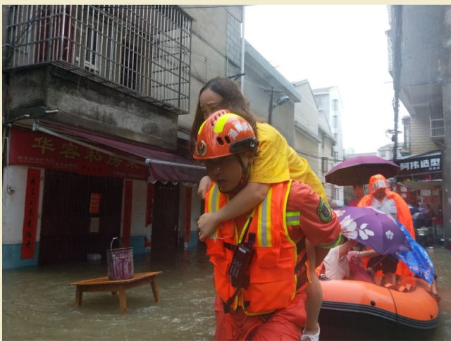
▲株洲消防员在转移被困居民 通讯员供图