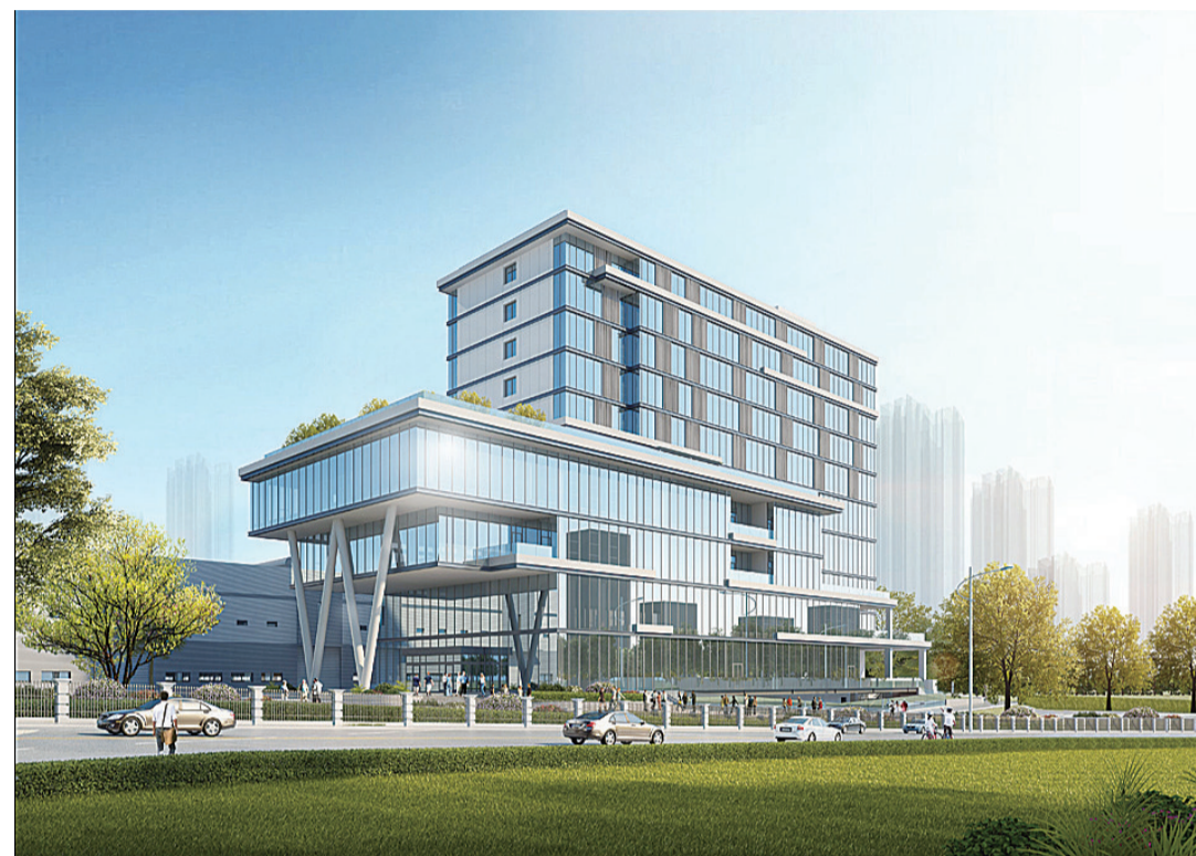
▲图为中天抗萧科研楼效果图,A级钢结构装配式建筑项目,项目一个月完成主体建设

建筑产业发展规划(2019-2025年),因地制宜全域统筹绿色装配式建筑发展规划,联合市发改委、财政局、资规局发布《株洲市绿色装配式建筑管理细则》(株建联字[2020]1号),对株洲地区绿色装配式建筑实施精细化管理;联合市财政局制定建筑节能与绿色建筑专项资金管理办法,引导示范创建,助力“六稳”“六保”目标实现,推进装配式建筑产业链现代化建设,推动我市建筑业转型升级向高质量高品质绿色方向发展。