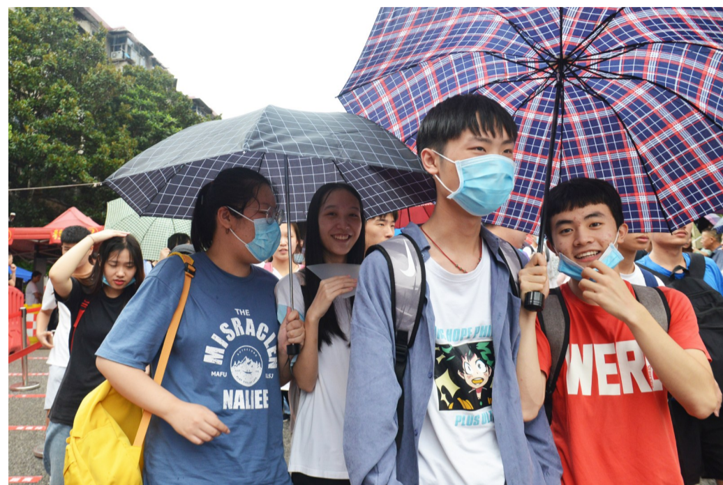
▲7月8日,考完啦!考生们开心地走出考场

本报讯(记者 何春林)昨日下午,市区下起了小雨,闷热中夹杂着些许凉爽。下午5时,2020年高考终于铃准时响起,我市高考顺利结束,两万多名考生陆续走出考场。