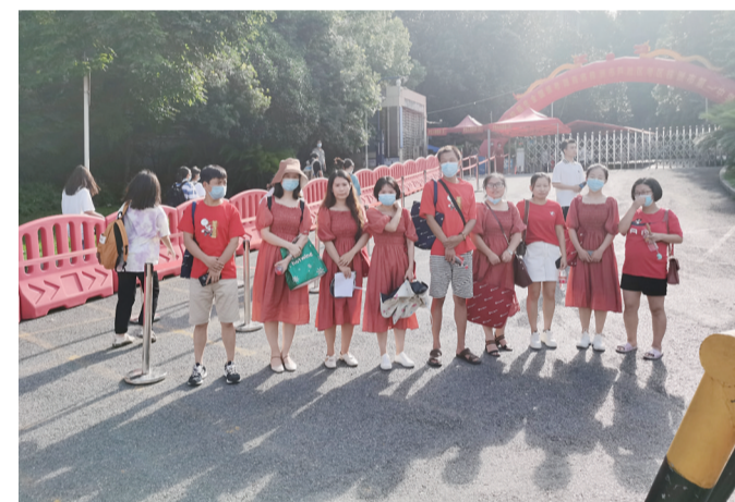
▲新凤凰中学女老师们穿着百褶裙

本报讯(见习记者 廖智勇)7月7日是2020年高考第一天,为了给考生们加油鼓劲,送考的任课老师们一个比一个有心,在各个考点门口,给孩子们上演了一场“时装秀”。