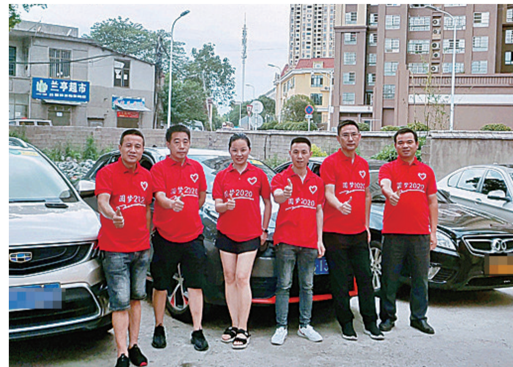
▲为表支持,社区为志愿送考者制作了统一服装

“孩子的考点在溁口区,请问能送吗?”“没问题,明早六点半我准时给您打电话。”“本来是想在考点边上找地方住的,结果计划有变,这时候申请是不是晚了?”“不晚,我来送。”7月6日晚,高考启幕前夜,石峰区丁山社区的几个业主微信群里还挺热闹,社区志愿者服务队的12名队员这两天会为社区的高考家庭提供免费送考服务。