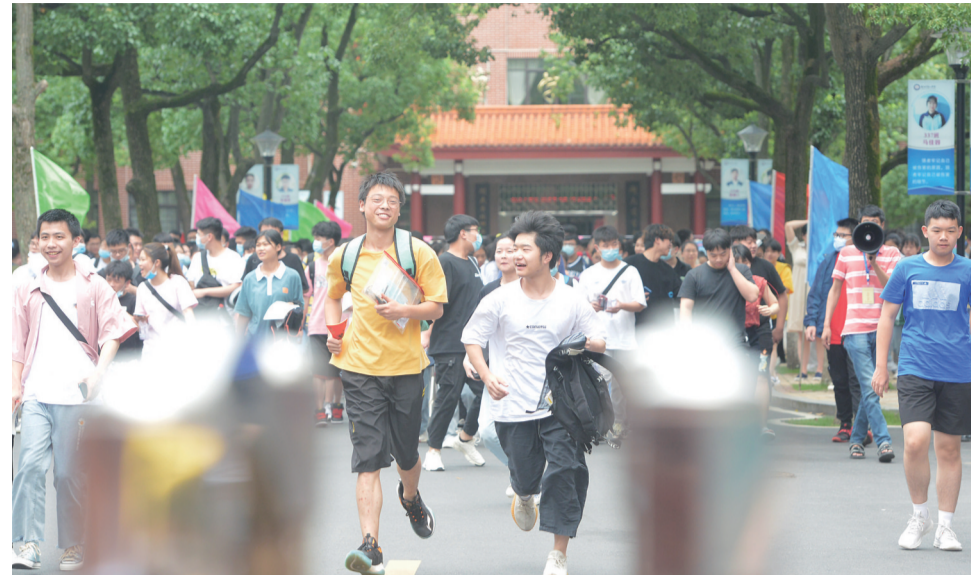
▲7日,市八中考点,上午的考试结束后,考生们开心地跑出考场