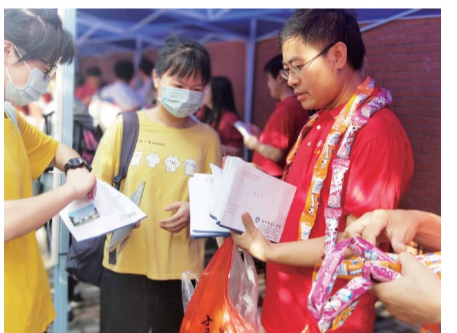
▲张老师给自己班上的每位考生准备了棒棒糖

该校高三1702班的谭红根老师,则为班上的每名参考生准备了一小块巧克力。(记者 何春林)