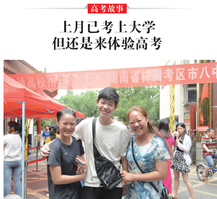
▲市八中考点,上午的考试结束后,小奥的妈妈和妹妹在考场外迎接他