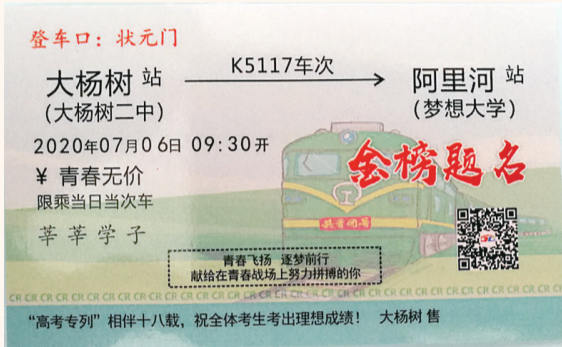
“高考专列”的纪念车票。