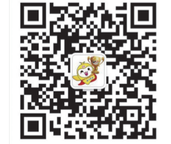
“成长吧!少年”公众号