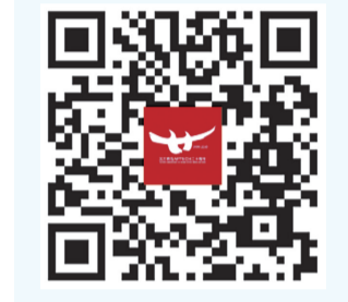
扫一扫 直达学校网站

学校地址: 株洲市石峰区井龙街道株洲健坤科技职业培训学校(原荷花学校) 学校网址: www.kqbdqn.com 学校电话: 0731-28279001 28279002