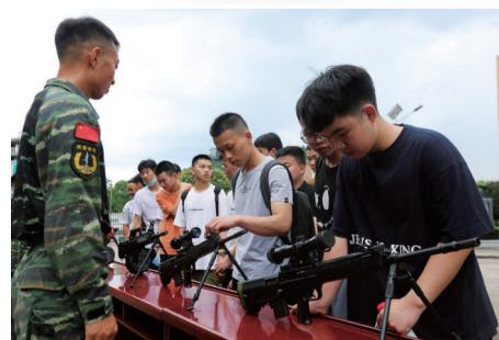
▲近距离观察武器装备 资料图

为此,“成长吧!少年”栏目第一时间联合武警株洲支队,开始筹备栏目的第一场线下活动。