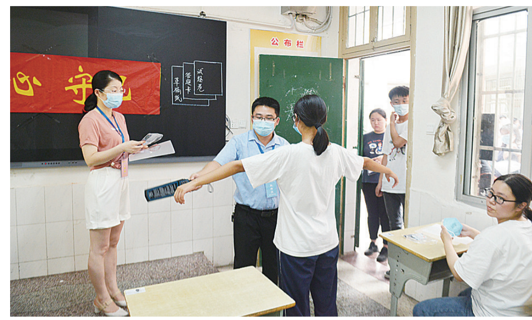
▲7月6日,市八中考点,考生在模拟安检