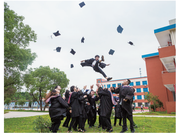
▲即将前往上海、广州等地应聘的健坤青鸟学子

日前,5G基建、大数据中心、人工智能、工业互联网等与大数据基础架构相关的“新基建”项目正在火热。有风就有机会御风而行,谁将抓住机会成为时代的宠儿?