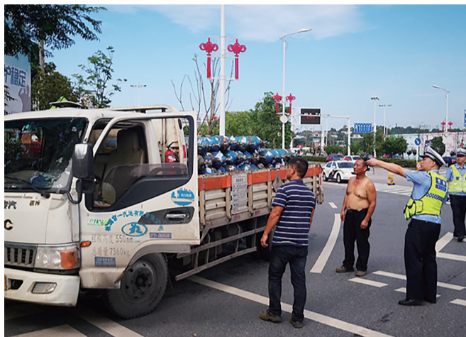
▲荷塘交警检查危险化学品运输车辆

前日上午,省公安厅交警总队副总队长彭立根来到荷塘区荷塘大道与S211交叉口,现场督导荷塘交警开展危化品运输整治行动。行动现场,民警对过往危化品运输车辆进行检查,发现部分车辆存在车身反光标识磨损、GPS定位系统未正常使用、司机未随身携带从业资格证和车辆道路运输证等问题,一辆运输液化气罐的小货车还涉嫌超载。对违反《道路交通安全法》相关规定的车主,民警责令其整改,并开出罚单。