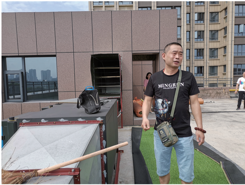
▲餐饮店在楼顶安装了油烟管道,后面是住宅楼

近日,“海创·明珠壹号”小区有业主拨打晚报新闻热线 28829110 反映:小区现在还没有交房,业主却发现临街商铺在经营龙虾店,油烟味很大,而且住宅的一楼电梯没有出入口,业主不能从一楼坐电梯,只能爬到二楼,或者下到负一楼。