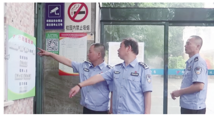
公安机关在南方中学进行考前安保准备工作检查。

高考在即,为确保考试安全顺利进行,7月3日,公安机关先后对城区的一中、八中、二中、十三中等七个高考考点进行安全保卫工作检查。行动旨在为莘莘学子提供一个安静、舒适的考试环境。