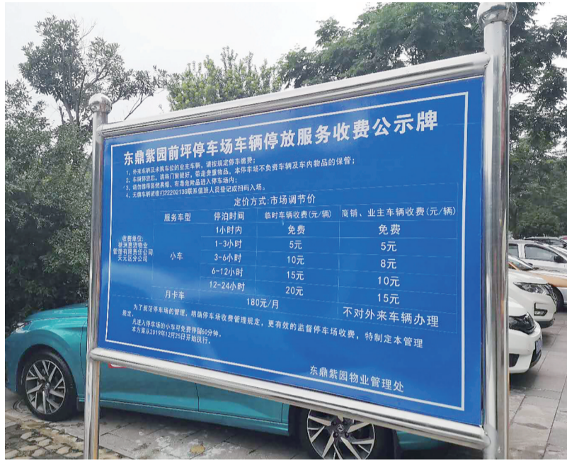
▲小区前坪停车场竖立的“收费公示牌”

近日,天元区东鼎紫园小区的业主向本报热线28829110反映:我们小区物业公司在许多业主不知情的情况下,在小区前坪的公共用地设置了道闸系统,建了一个收费的停车场。