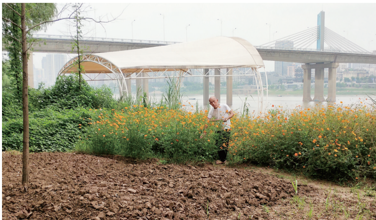
▲熊础坚正在打理波斯菊