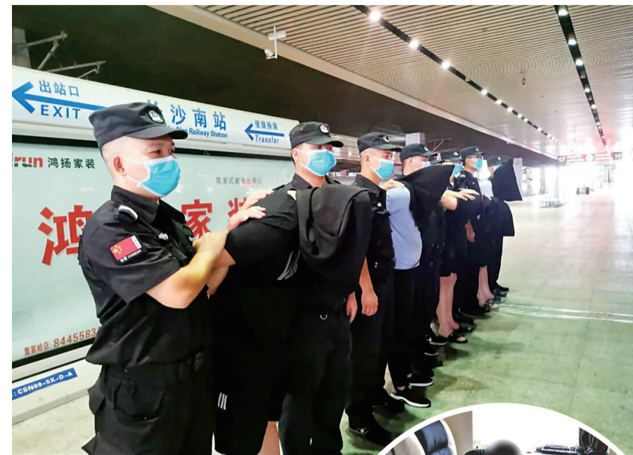
▲警方押解犯罪嫌疑人归案

目前,6名犯罪嫌疑人因涉嫌诈骗被茶陵县公安局依法刑事拘留,案件正在进一步深挖办理中。