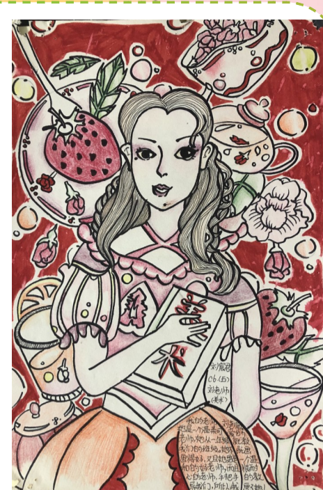
白鹤小学 1405班 刘宸君《我心中的最美老师》 指导老师:刘意

凿石小学一直大力倡导健康生活方式,发挥“家庭体育”在疫情防控期间的积极作用,而对一个孩子来说,人生路上还有很多座比武功山还高的“山峰”需要她,值得她去征服和挑战。“不要让孩子变成温室里的花朵,因为这个世界很美好的同时也很残酷。”唐海怡父母说。