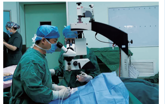
▲二医院专家表示,白内障患者只要及时进行专业的手术治疗,就可以恢复视力,白内障致盲是可逆的。图为手术现场。

据了解,自株洲市二医院眼科开展“复明工程”以来,定期在医院、社区、街道进行免费筛查,目前已为上万居民提供免费筛查服务,几百名白内障患者因此重见光明。