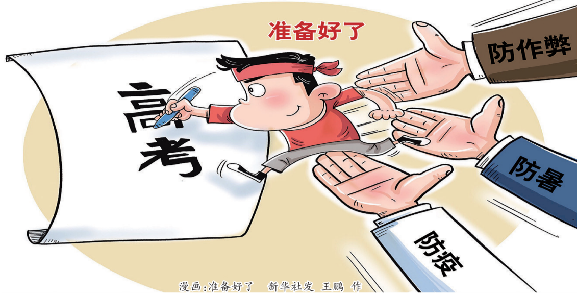
漫画:准备好了 王鹏 作

考务人员也是高考防疫的重要对象。福建漳州、三明等地对所有考务人员进行核酸检测,并开展防疫专项培训和专门演练。今年与考务人员均需出示“八闽健康码”,显示绿码方能进入考场。针对考点以外可能存在的疫情传播风险,重庆市卫生健康执法部门从6月底开始对考点学校周边酒店进行拉网式卫生监督,重点检查卫生许可证、从业人员健康证、公共用品用具的清洗消毒保洁、顾客信息登记、体温监测情况等,确保考生住宿环境卫生安全。