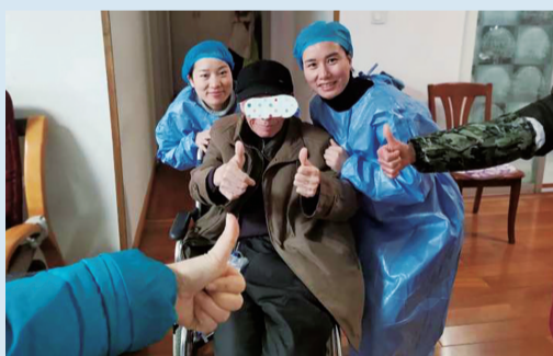
▲张爷爷在接受完尿管护理后,对护士们的专业、贴心的服务竖起了大拇指。

作为最早在株洲地区开展“互联网+护理服务”的试点医院之一,株洲市三三一医院在2019年12月就开启了“互联网+护理服务”的新模式。