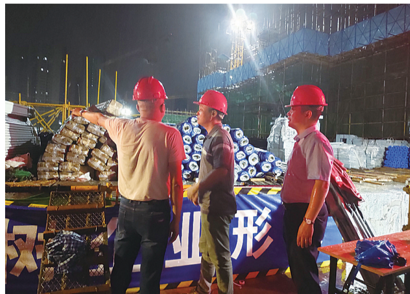
▲昨晚,株洲市生态环境部门在城区检查20余家在建工地项目

本报讯(记者 杨凌凌 通讯员 崔林)高考、学考和中考临近,全城“静音”,这是惯例。今年株洲“禁噪特护期”从6月22日至7月18日。昨日,株洲市生态环境保护综合行政执法支队制定“禁噪”方案,为考生营造一个安静的环境。