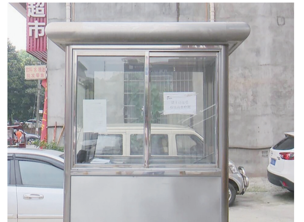
▲岗亭里没有保安值班